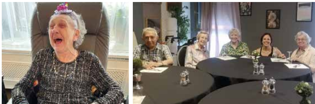
« Je connais un moyen de ne pas vieillir : c'est d'accueillir les années comme elles viennent et avec le sourire... un sourire, c'est toujours jeune. » Pierre Dac / L'Os à moelle - Juni 1939