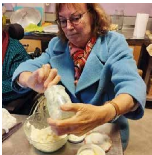
déi steif Ram an eng Schossel ginn