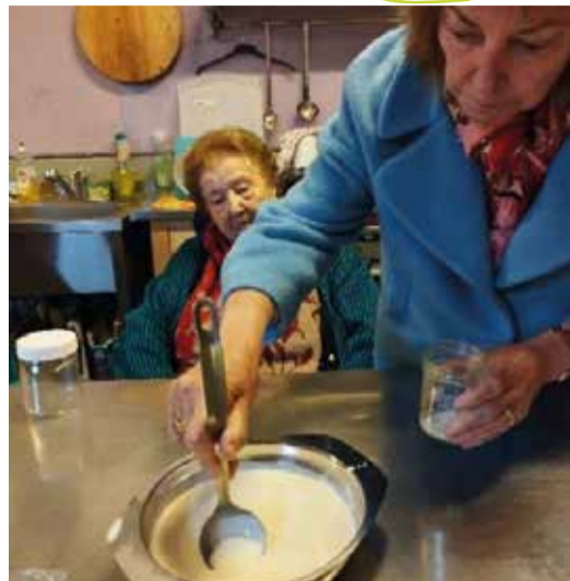
Ram vun der frëscher Koumëllech trennen