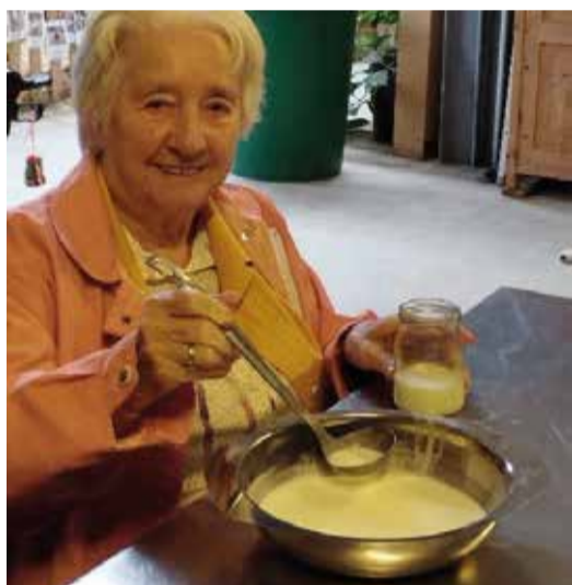
getrennt Ram an e Glas ginn