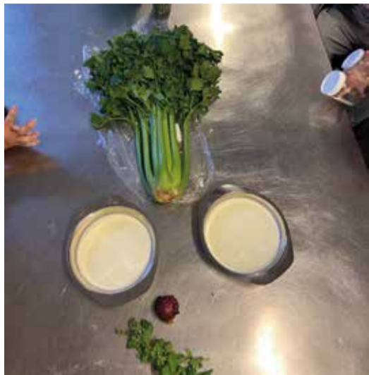
Zutate fir Kraiderbotter hierzestellen