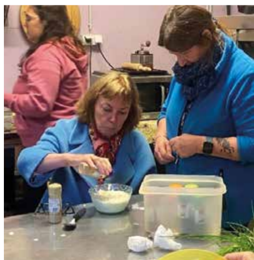
mat Salz an Pepper wärzen