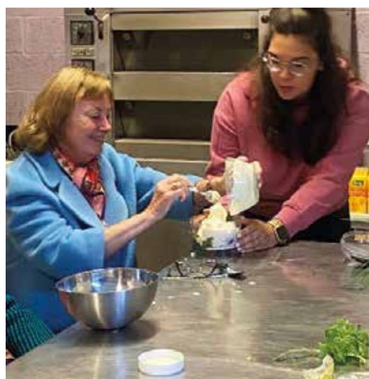
alles vermëschen an an den Tifküler leeën.