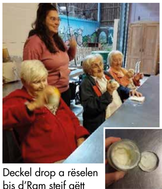
Deckel drop a rëselen bis d'Ram steif gëtt