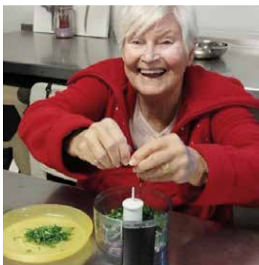
Kraider, Knuewelek an Zwiwwelen dobäi ginn